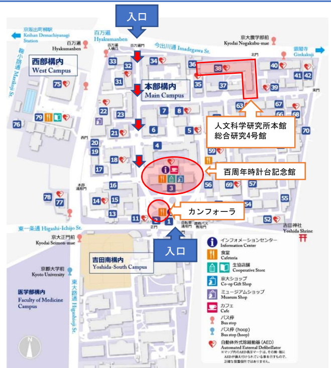
キャンパスマップ

住所：〒606-8501 京都市左京区吉田本町 アクセス：http://www.kyoto-u.ac.jp/ja/access/