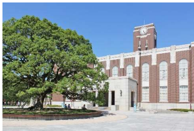
京都大学 吉田キャンパス

技術士専門分野の融合による新たなイノベーションへ ～世界水準・最先端技術力保有の京都で～